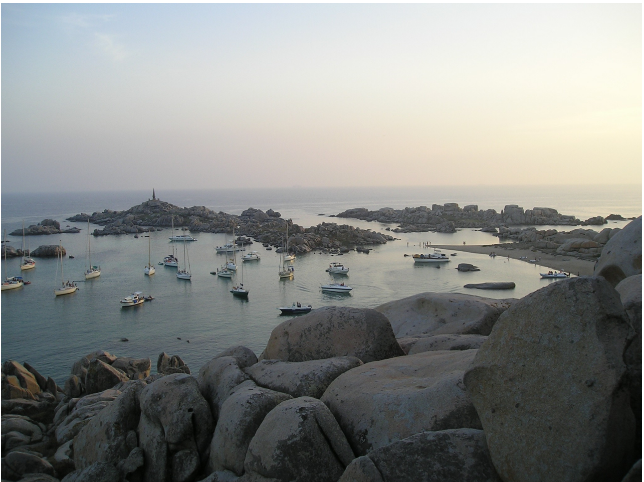
Cala Lazzarina a Lavezzi (FR)

L'ormeggio in rada è una delle realtà più belle e affascinanti della vita a bordo, che permette di godersi appieno i momenti di relax dalla navigazione, la quiete della notte lontano dal fracasso delle banchine, la bellezza di un tramonto e la brezza notturna estiva.